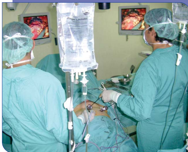
La laparoscòpia és una tècnica quirúrgica menys agressiva

2006 la cirurgia laparoscòpica de l'adenoma de pròstata i durant el 2007 la de la cistectomia total per càncer de bufeta urinària.