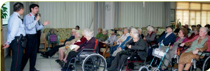
Els Mossos d'Esquadra van explicar 10 casos d'estafes al Centre Geriàtric Adolfo Montaña

Seguint el cicle establert d'accions educatives adreçades al col·lectiu de les persones grans i amb l'objectiu d'apropar la ciutadania de Granollers a l'Hospital de l'FHAG, el passat 26 de març la policia de la Generalitat coneguda pel nom de "Mossos d'Esquadra" van venir al Centre Geriàtric Adolfo Montaña a oferir una xerrada sobre les mesures que hem de prendre davant de qualsevol estafa.