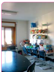
Antiga Sala de Jocs

Fruit de l'esforç i la solidaritat del cos de Mossos d'Esquadra de Granollers i del Club Esportiu Trencacames, format per membres de la Policia Local i Bombers de Granollers, avui els nens de la planta de pediatria de l'Hospital de Granollers gaudeixen de nou mobiliari, material infantil i joguines.